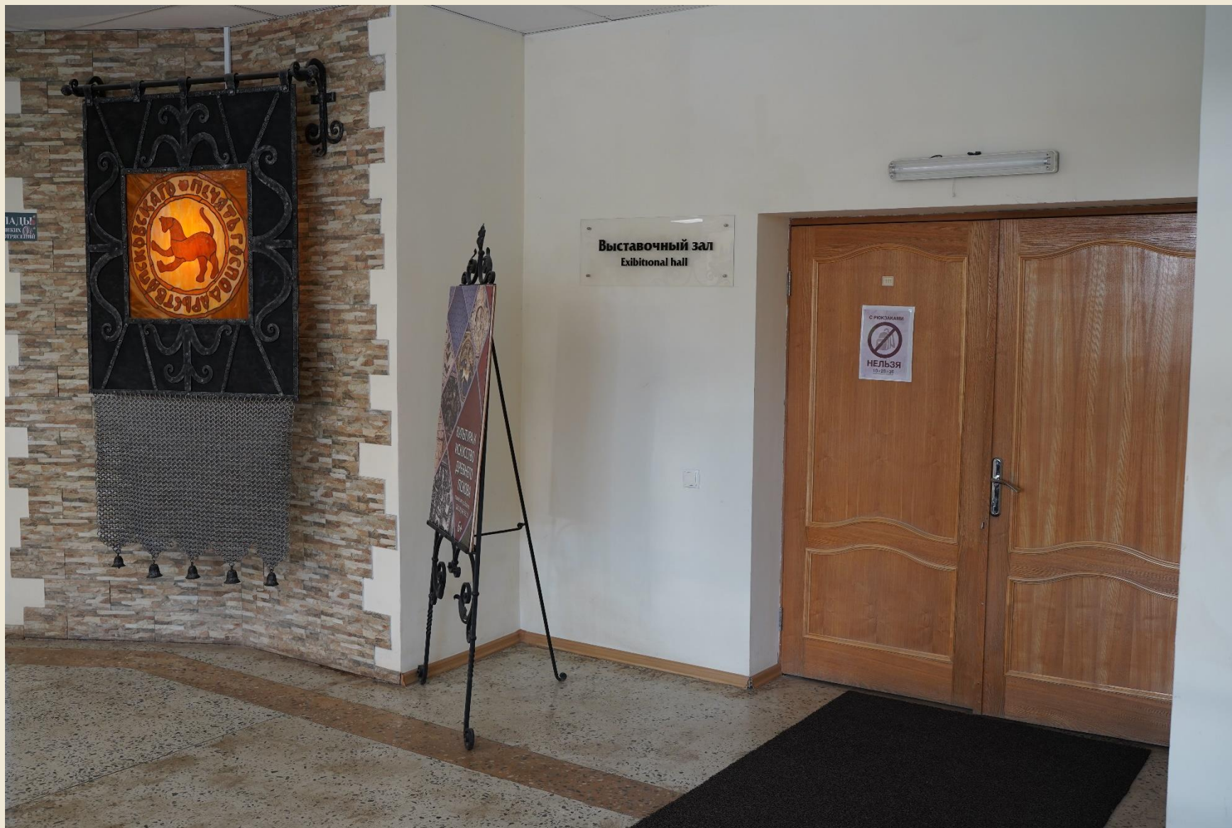
Это вход на выставку