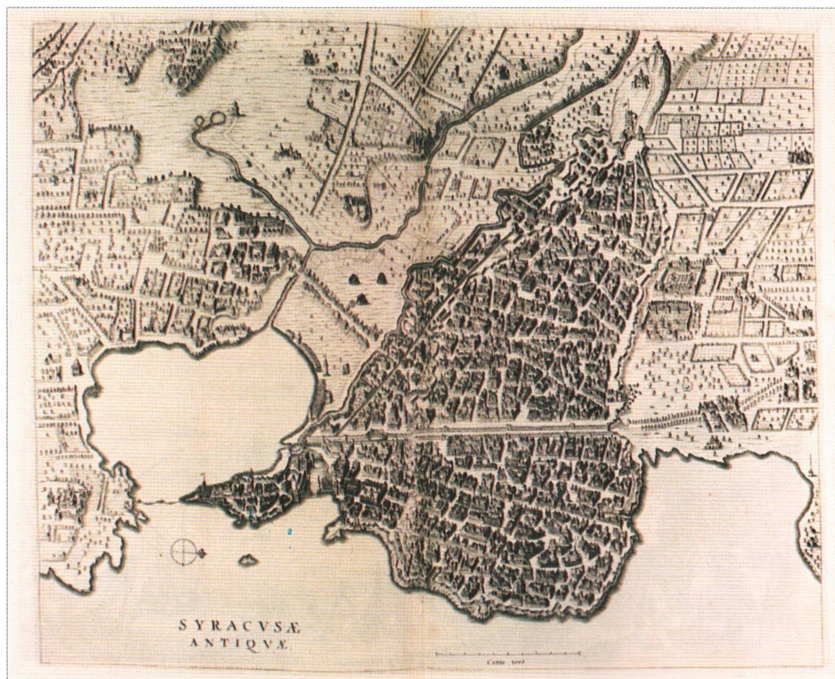
Рис. 4. Гравюра. « Syracusae Antiquae » – «Древние Сиракузы»