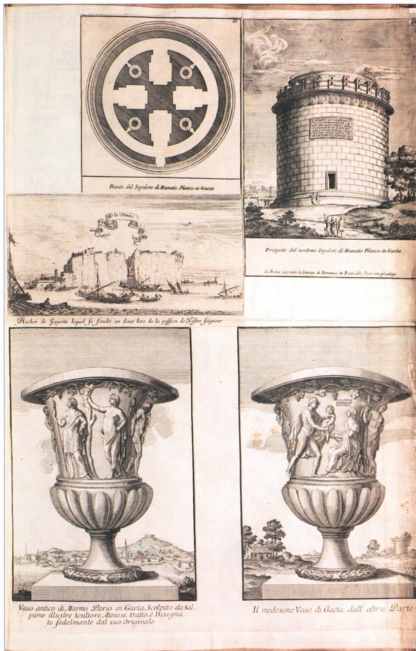
Рис. 6. Пять гравюр из книг XVII–XVIII вв., наклеенные на лист и вплетенные в Атлас