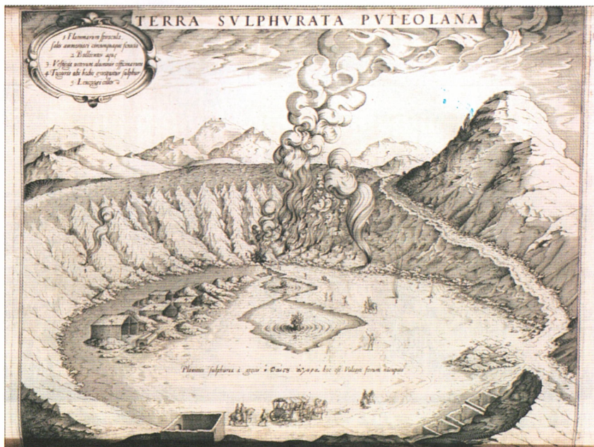
Рис. 1. Гравюра. «Terra Svlphvrata Pvteolana» – «Земля Сольфатара. Поццуоли»