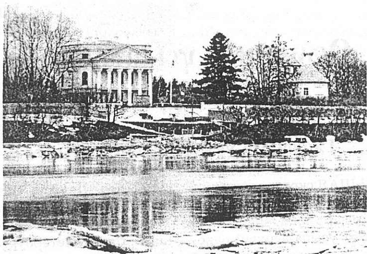
Вид Корытова с реки Великой.