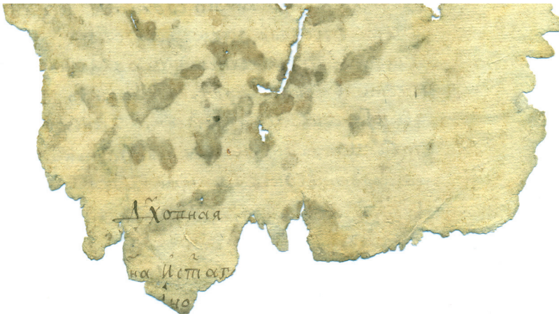
Рис. 1. Консistorский список 1732 г. с харатейной духовной грамоты преподобного Евфросина. Л. 7.