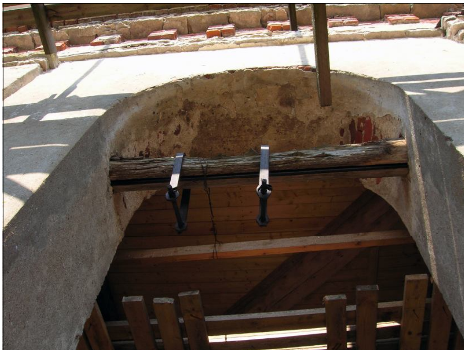
Проём верхнего яруса колокольни. Фото 2010 г.