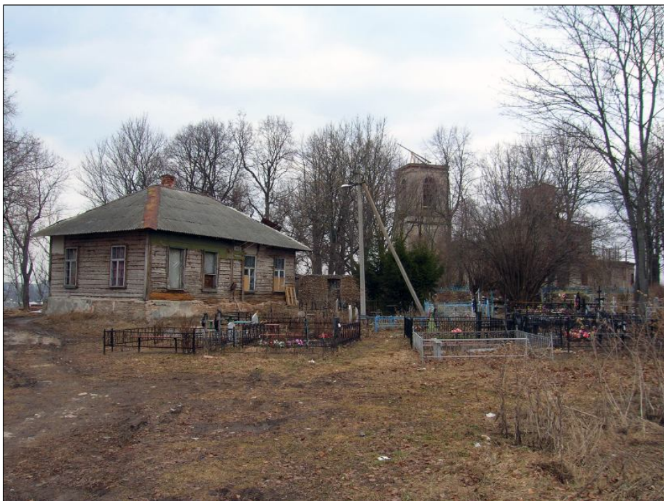
Здание церковно-приходской школы в Кусве 1895 г. Фото автора, апрель 2006 г.