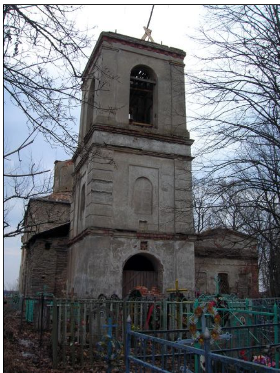
Колокольня 189596 г.