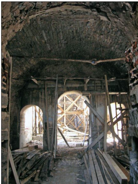
Притвор. Вид с запада на восток. Фото автора, апрель 2010 г.