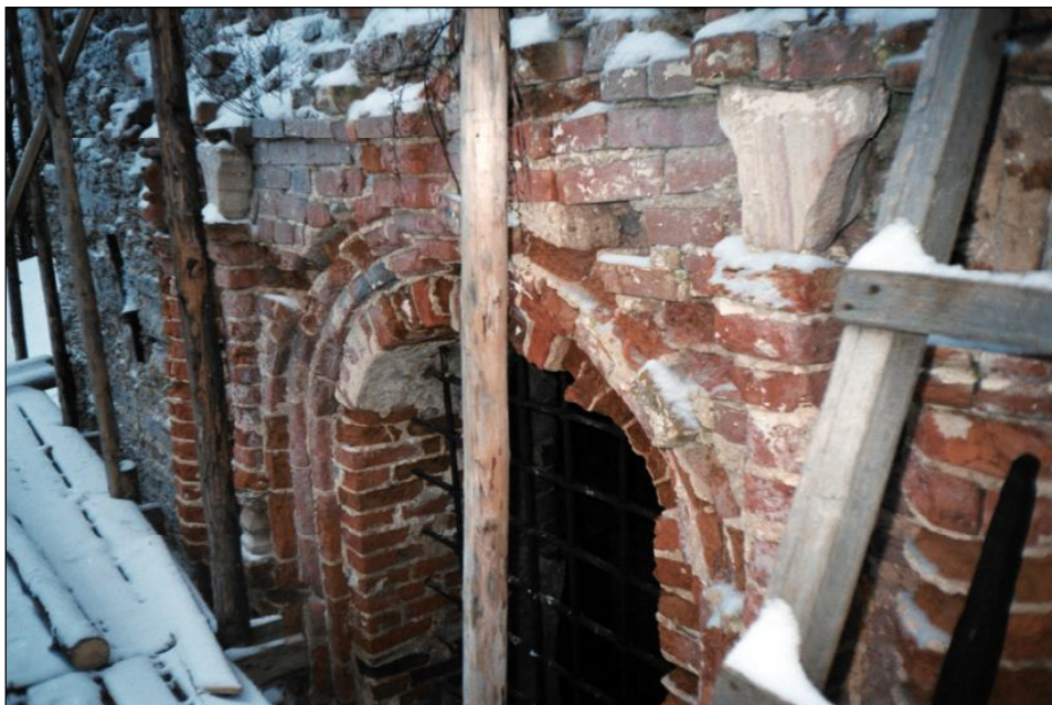
Фрагмент Декоративного наличника южного окна. Фото 2001 г.