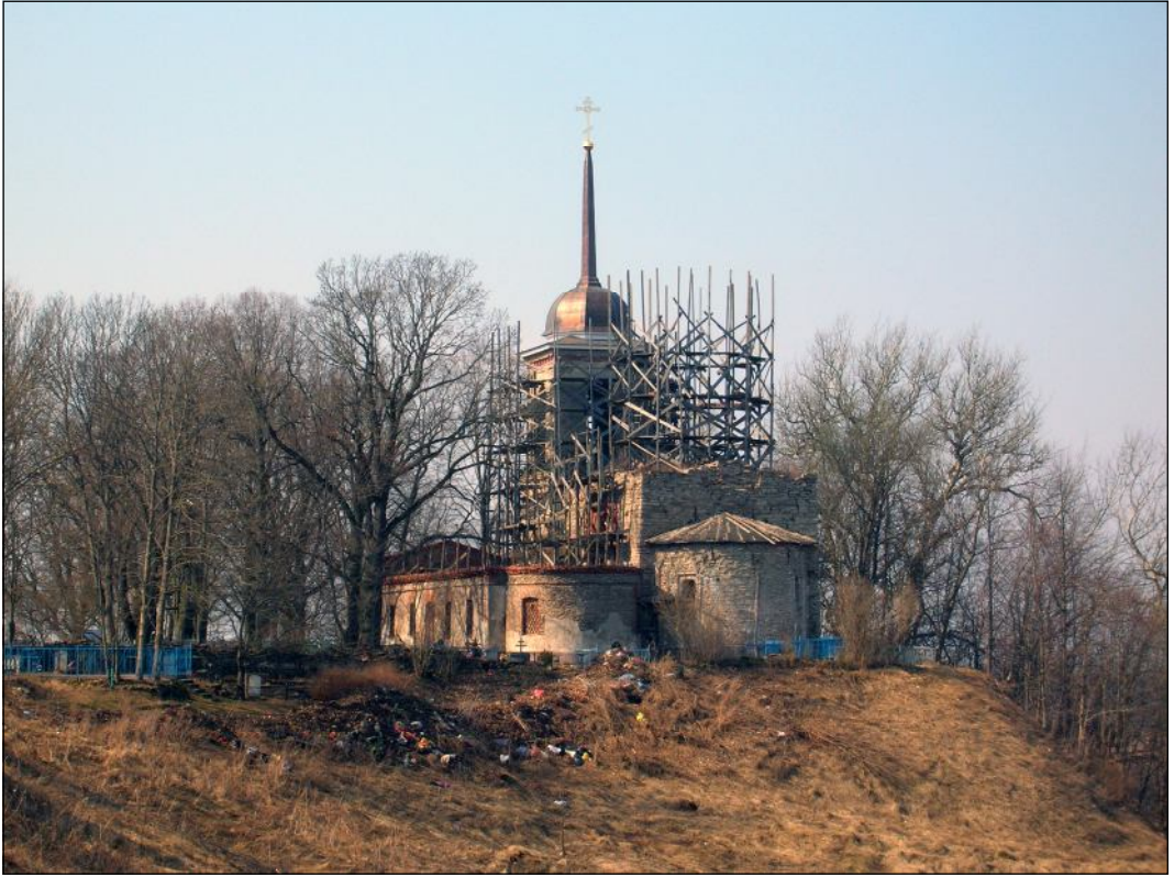
Современное состояние храма. Апрель 2010 г.