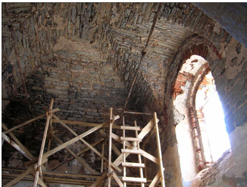
Своды и южное окно четверика. Фото автора, апрель 2010 г.