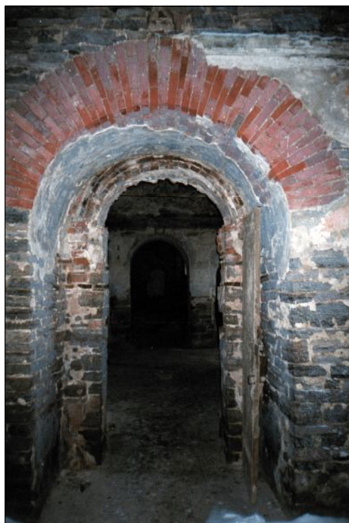
Портал западных дверей храма. Вид из паперти под колокольней.