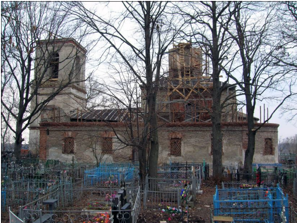
Вид церкви с юга со стороны кладбища. Фото 2006 г.