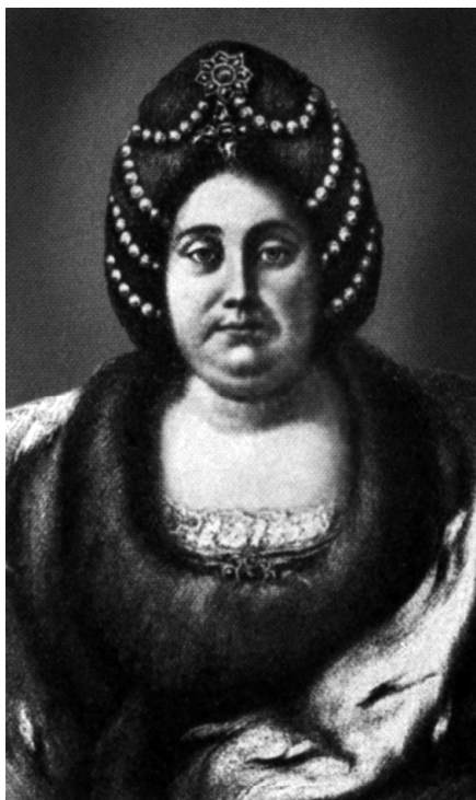
Царица Прасковья Федоровна Салтыкова, вдова Царя Ивана Алексеевича. Худ. И. Н. Никитин. Первая четв. XVIII в.