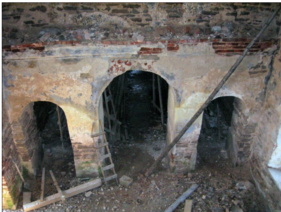
Западная стена четверика. Вид с востока. Фото автора, 2010 г.