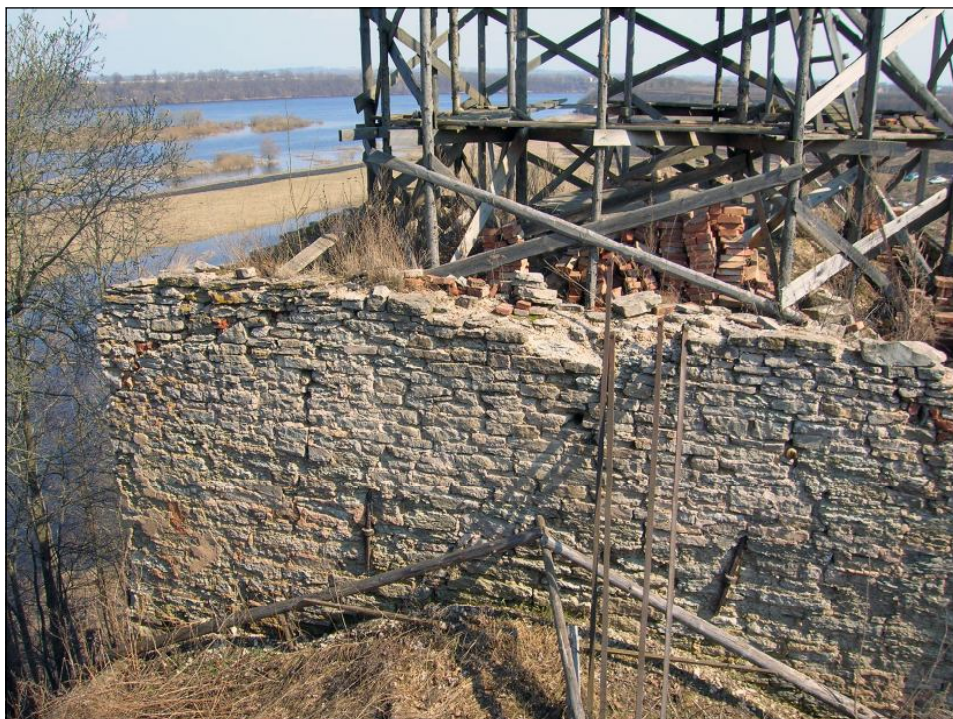
Западная стена четверика XVII в. Барабан XIX в. разобран. На углах стен следы восьмискатной кровли. Фото 2010 г.