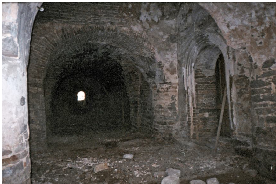
Притвор. Вид с севера на юг. 2001 г.