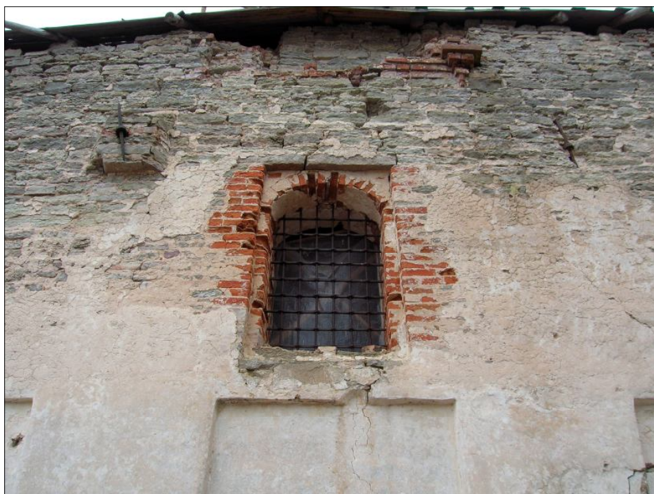
Окно северной стены, над которым видны остатки кирпичного киота, помещавшегося в щипце восьмискатной кровли. Фото автора, 2006 г.