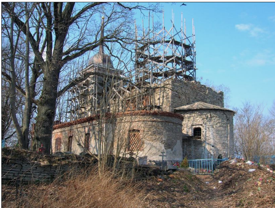
Храм в процессе реставрации. Вид с юго-востока, апрель 2010 г.