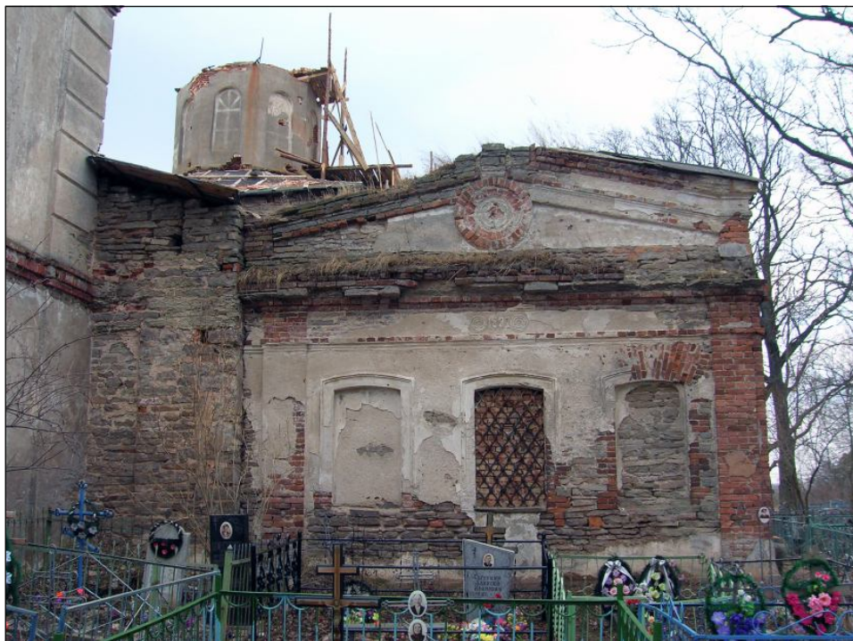
Придел Тихвинской иконы Богородицы 1887 г. Западный фасад. Фото 2006 г.