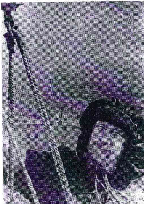
На шпиле Петропавловского собора

В проекте Спегальского предполагалось сохранить, наряду с археологическими и архитектурными памятниками, элементы планировки древнего города. Псков в его исторической части, по мнению Юрия Павловича, должен был стать городом-музеем под открытым небом. Но в послевоенных ус-