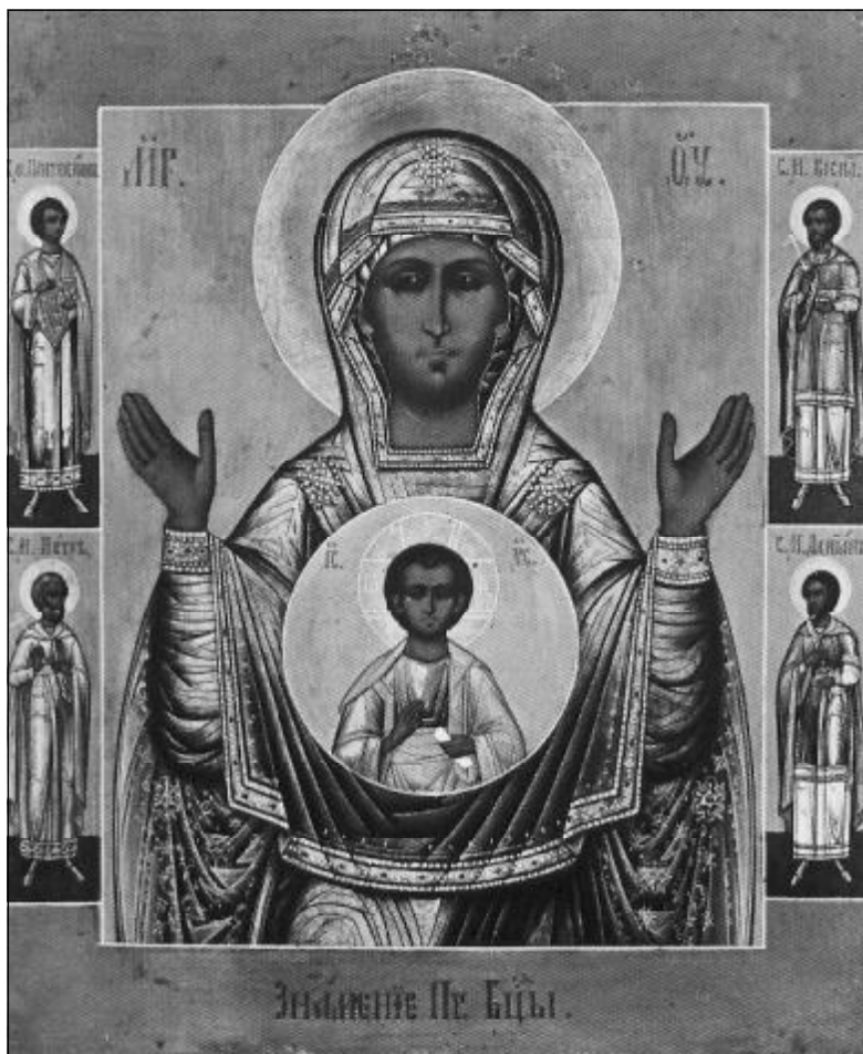
Богоматерь «Знамение». Копия чудотворной иконы конца XVIII в. (частная коллекция, Париж.)