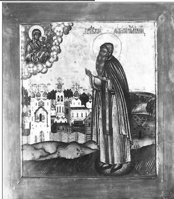
Семён Никитин. «Св. Антоний Римлянин». 1680 г. Новгород.