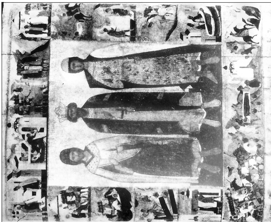
Свв. Владимир, Борис и Глеб с житием. Первая половина XVI века. Москва. (ЛТГ, ранее в ГИМ).